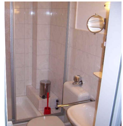
Dusche /WC, Föhn