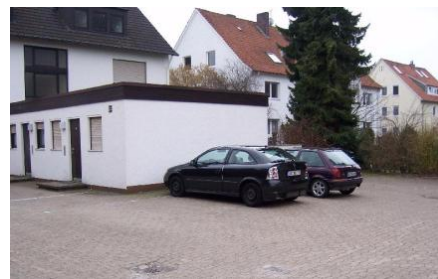
Kostenlose Parkplätze direkt am Haus