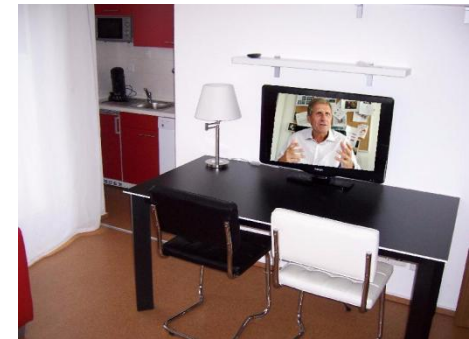
WLAN + TV mit Satelliten-Programmen