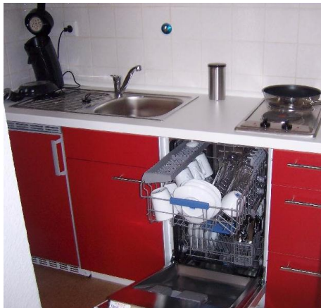
Komplett eingerichtete Küche