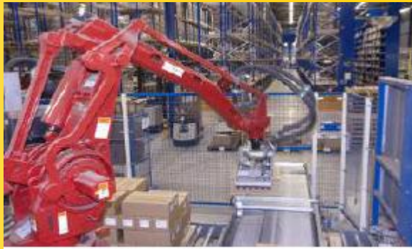
Etikettendruck in der Automation