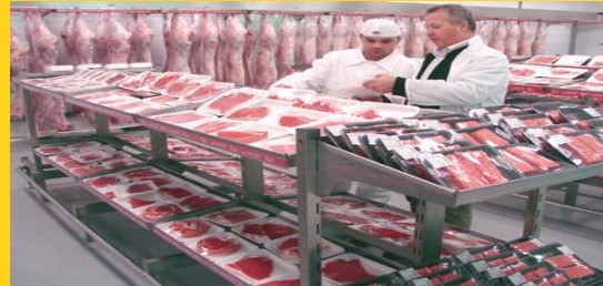
Kennzeichnung im Lebensmittel-Bereich