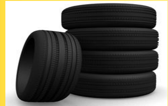
Kennzeichnung im Automotive-Bereich