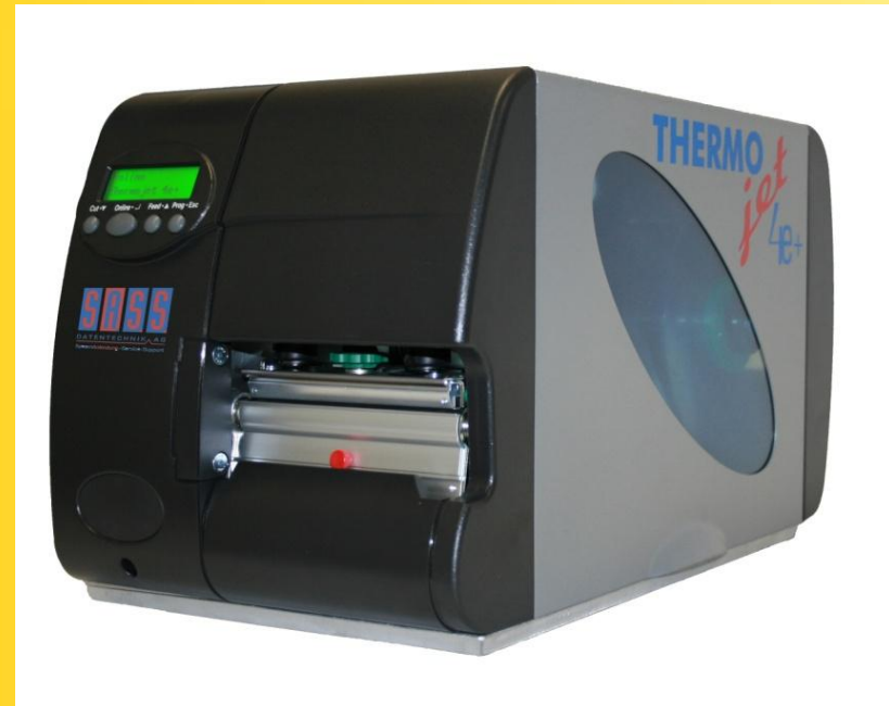
THERMOjet 4e+ Industrie-Drucksysteme für den Thermodirekt- und Thermotransfer-Druck

Gerne erhalten Sie zum THERMOjet 4e+ weitere Informationen über Ihre Vorteile sowie über die modularen Erweiterungsmöglichkeiten.