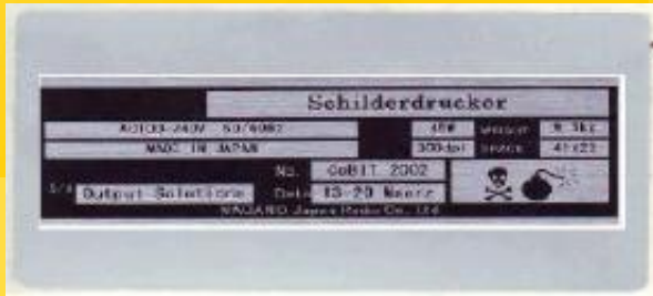
Druck von Typenschildern