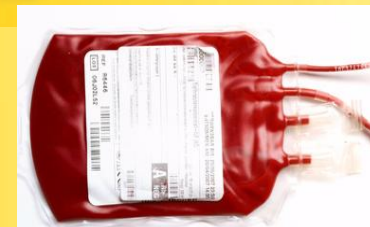
In der Medizin-Technik

Für die Weiterverarbeitung Ihrer Etiketten auf Rolle, stehen Ihnen externe Rewinder zur Verfügung, unabhängig davon ob Ihre Mitarbeiter die Etiketten manuell von der Rolle verarbeiten oder Sie z. B. über einen Applizierer Ihre Etiketten automatisiert weiterverarbeiten.