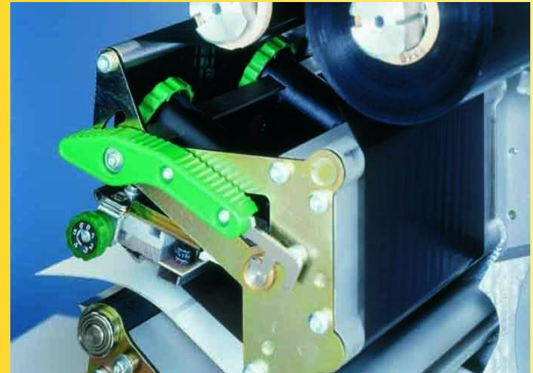
THERMOjet 4e+ für den schnellen Media-Wechsel