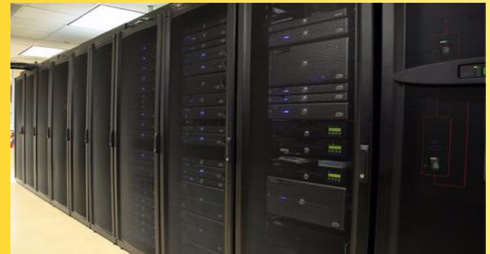
THERMOjet 4e+ für den bequemen Barcode-Druck

Wenn Sie Ihre Daten aus einer Windows-Umgebung an den THERMOjet 4e+ senden, werden diese vom Drucker aufgrund seines controllerseitigen High End RISC-Prozessors extrem schnell aufbereitet. Das spart kostbare Wartezeiten in der Druckausgabe.