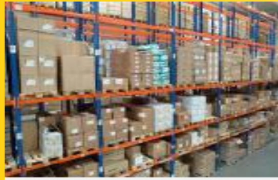
Warenkennzeichnung im Lager